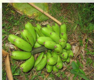
Trovi ya moïna