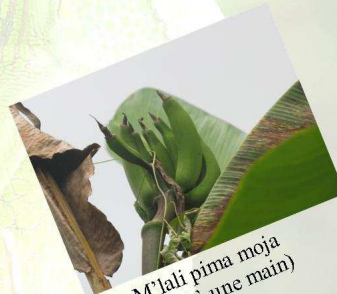
M'lali pima moja (mlali à une main)