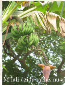
M'lali dzidou rachis nu